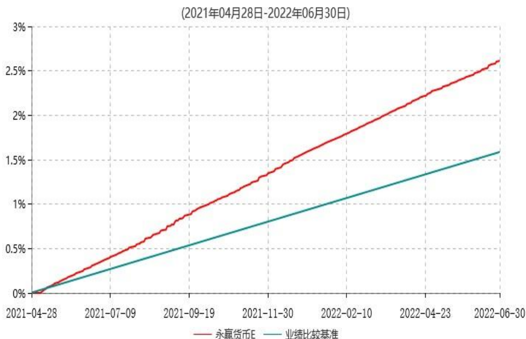
永赢货币E累计净值收益率与业绩比较基准收益率历史走势对比图