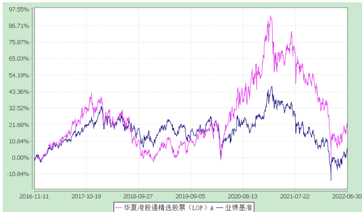
华夏港股通精选股票 C