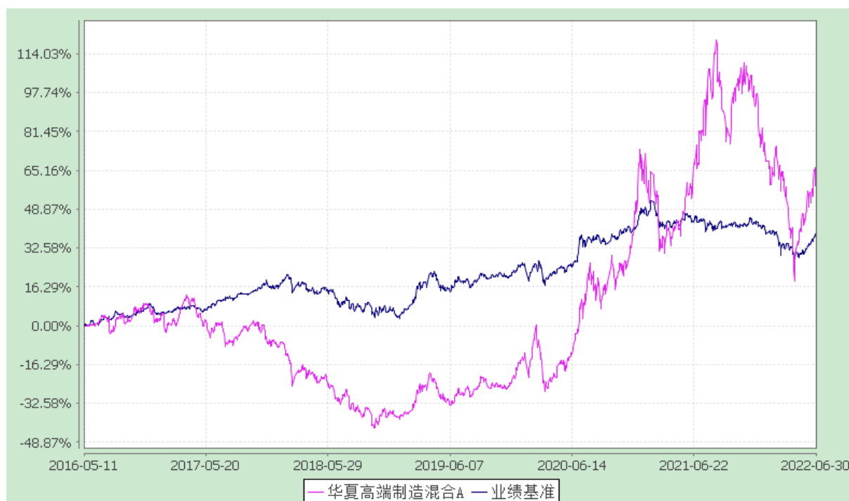
华夏高端制造混合 C