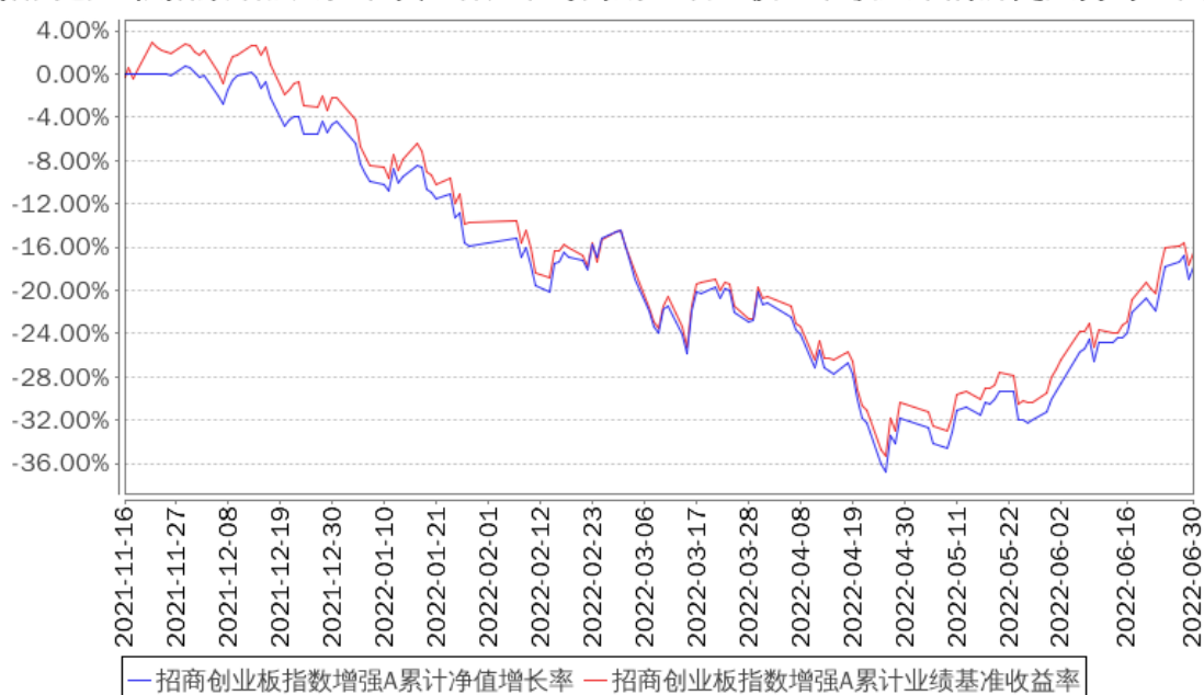
招商创业板指数增强A累计净值增长率与同期业绩比较基准收益率的历史走势对比图