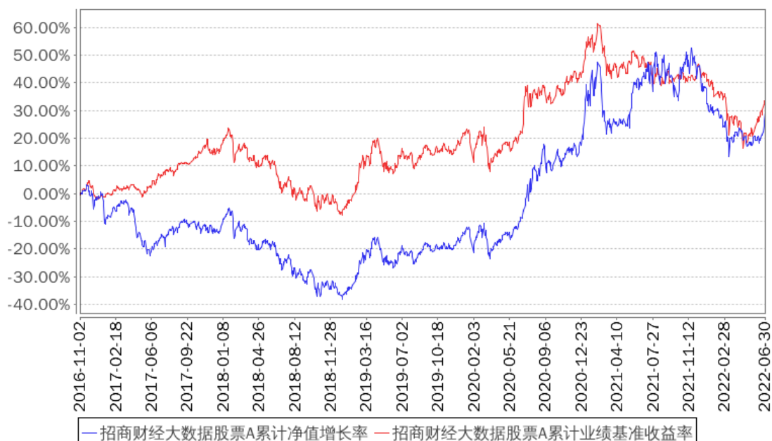
招商财经大数据股票A累计净值增长率与同期业绩比较基准收益率的历史走势对比图