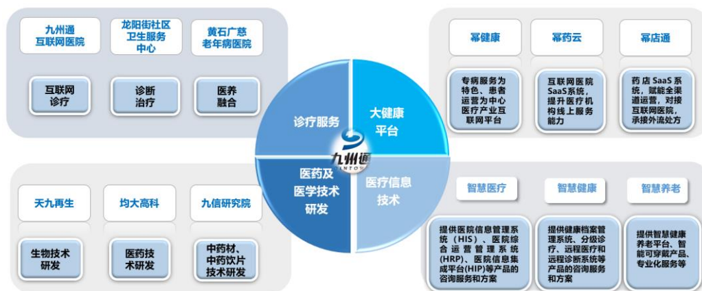
图 2 医疗健康及技术增值服务内容

2.报告期内公司所处行业情况，包括所处行业基本情况、发展阶段、周期性特点等，以及公司所处的行业地位、面临的主要竞争状况，可结合行业特点，针对性披露能够反映公司核心竞争力的行业经营性信息