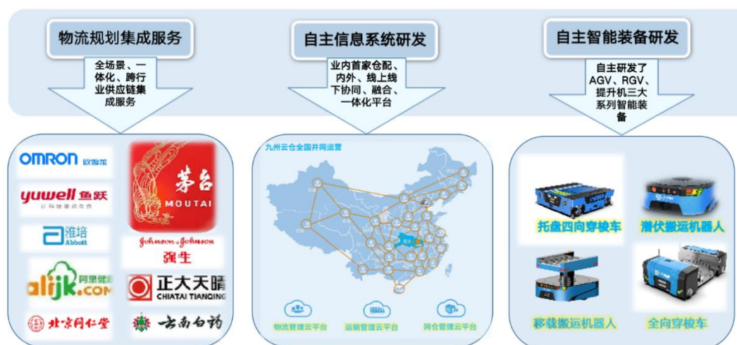
图 1 九州通物流增值服务及科技赋能

公司根据市场需求自主研发 RGV 系列、AGV 系列、提升机系列物流智能设备，并针对市场上各类应用场景，通过算法的迭代及结构的优化，不断打磨产品，打造出了轻/重装备结合的智能物流设备解决方案。