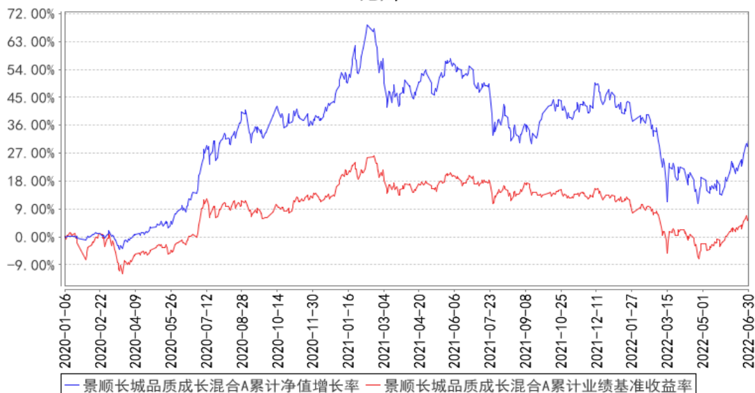
景顺长城品质成长混合A累计净值增长率与同期业绩比较基准收益率的历史走势对比图