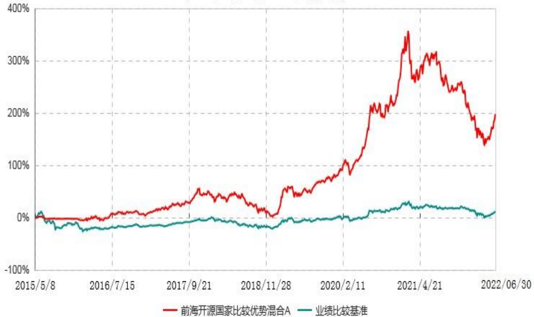
前海开源国家比较优势混合A累计净值增长率与业绩比较基准收益率历史走势对比图 (2015年05月08日-2022年06月30日)