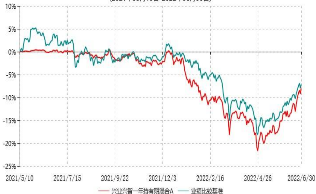
兴业兴智一年持有期混合A累计净值增长率与业绩比较基准收益率历史走势对比图 (2021年05月10日-2022年06月30日)

本基金合同自 2021 年 5 月 10 日生效，根据本基金合同规定，本基金自基金合同生效之日起 6 个月内已使基金的投资组合比例符合基金合同的有关约定。