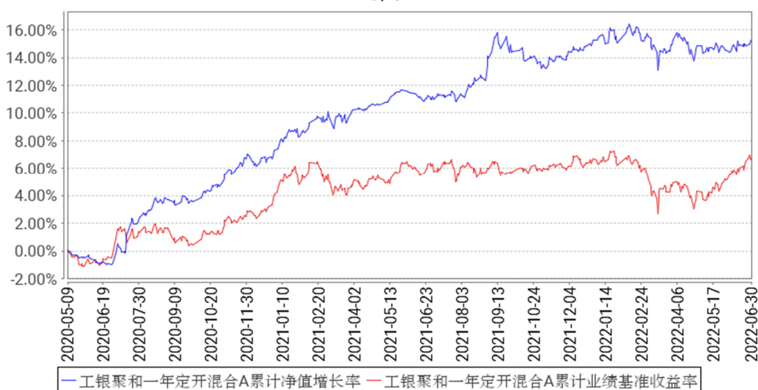
工银聚和一年定开混合A累计净值增长率与同期业绩比较基准收益率的历史走势对比图