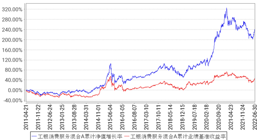
工银消费服务混合A累计净值增长率与同期业绩比较基准收益率的历史走势对比图