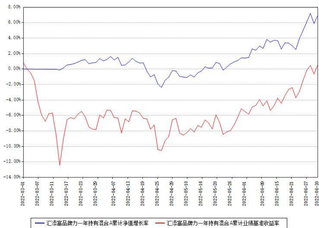
汇添富品牌力一年持有混合A累计净值增长率与同期业绩基准收益率对比图