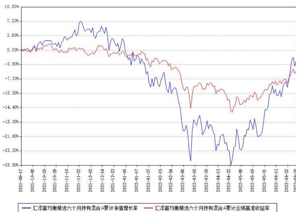
汇添富均衡精选六个月持有混合A累计净值增长率与同期业绩基准收益率对比图