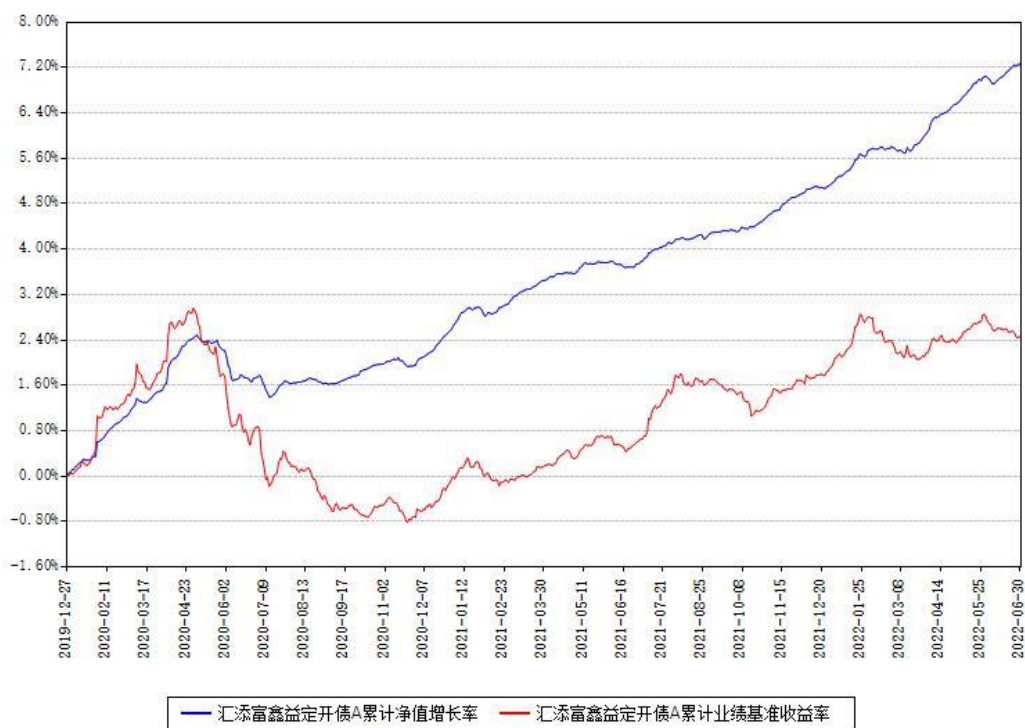
汇添富鑫益定开债A累计净值增长率与同期业绩基准收益率对比图