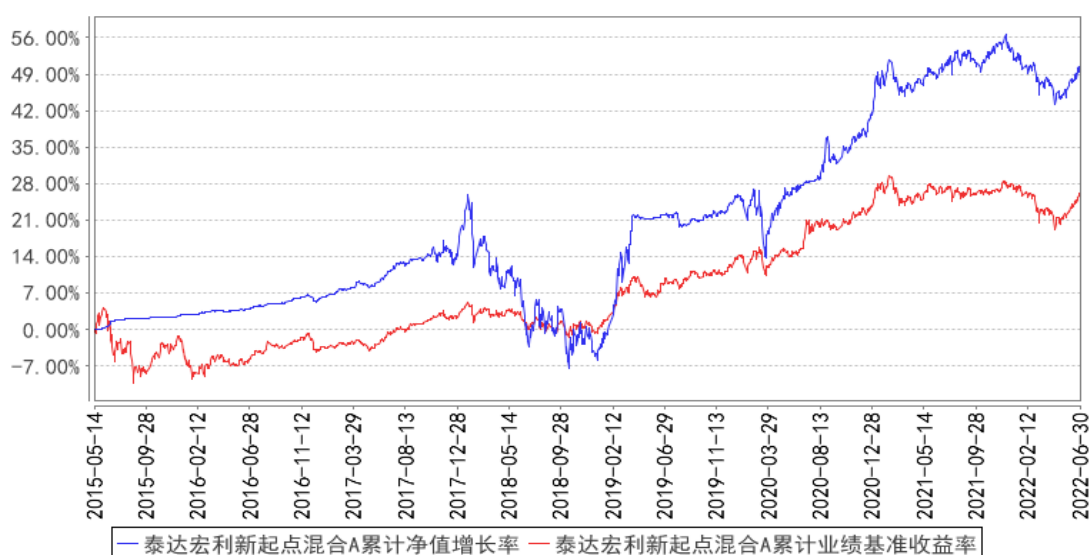
泰达宏利新起点混合A累计净值增长率与同期业绩比较基准收益率的历史走势对比图