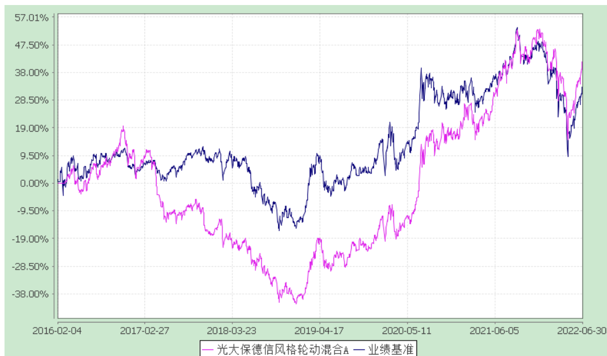
光大保德信风格轮动混合 C