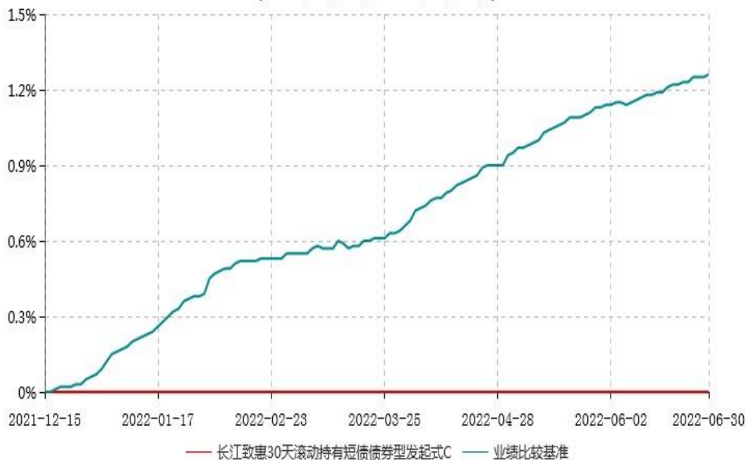
长江致惠30天滚动持有短债债券型发起式C累计净值增长率与业绩比较基准收益率历史走势对比图 (2021年12月15日-2022年06月30日)