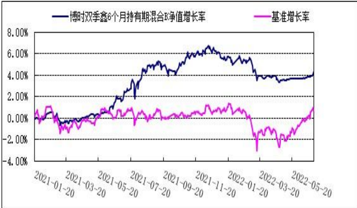
博时双季鑫 6 个月持有期混合 C