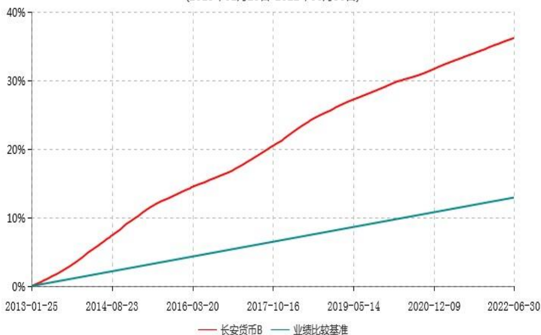
长安货币B累计净值收益率与业绩比较基准收益率历史走势对比图 (2013年01月25日-2022年06月30日)

本基金的收益分配是按月结转份额。按基金合同规定，本基金自基金合同生效起 6 个月为建仓期，截止到建仓期结束时，本基金的各项投资组合比例已符合基金合同的相关规定。图示日期为 2013 年 01 月 25 日至 2022 年 06 月 30 日。