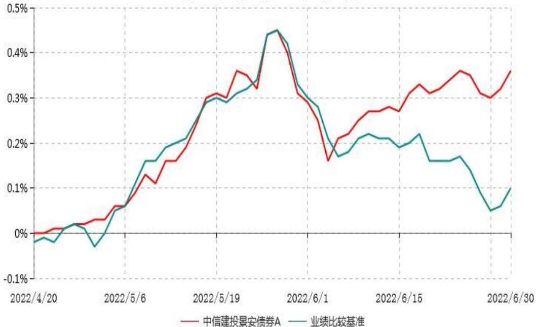
中信建投景安债券A累计净值增长率与业绩比较基准收益率历史走势对比图 (2022年04月20日-2022年06月30日)