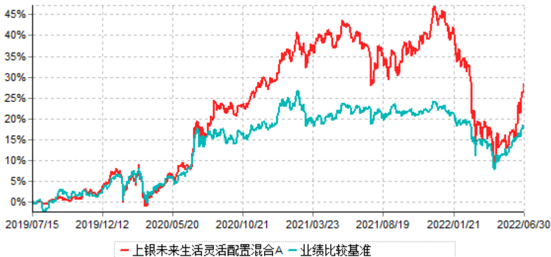
上银未来生活灵活配置混合A累计净值增长率与业绩比较基准收益率历史走势对比图 (2019年07月15日-2022年06月30日)