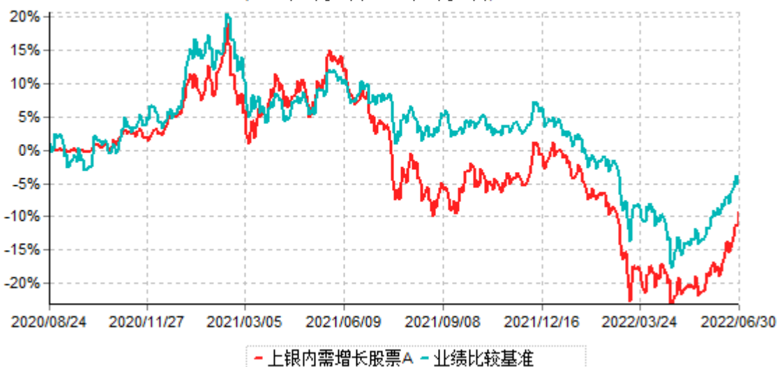
上银内需增长股票A累计净值增长率与业绩比较基准收益率历史走势对比图 (2020年08月24日-2022年06月30日)