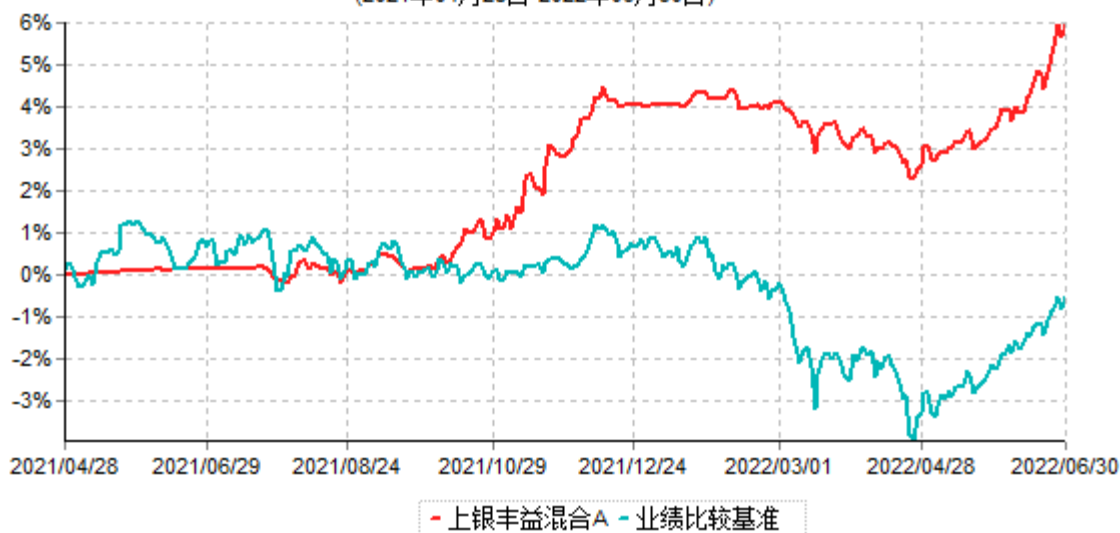
上银丰益混合A累计净值增长率与业绩比较基准收益率历史走势对比图 (2021年04月28日-2022年06月30日)