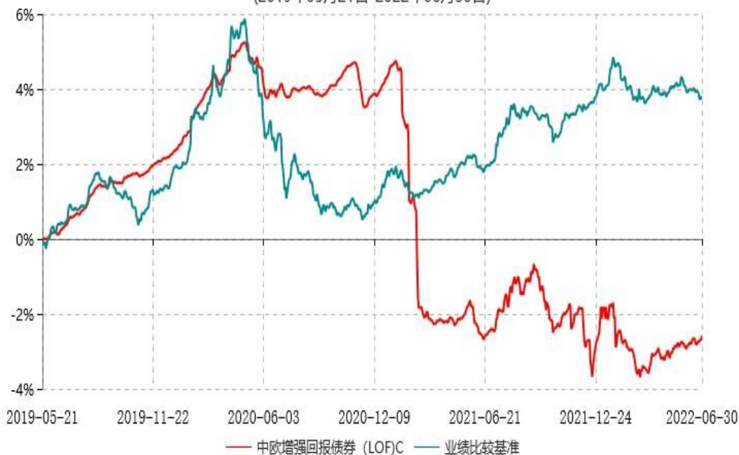
中欧增强回报债券（LOF）C 累计净值增长率与业绩比较基准收益率历史走势对比图 (2019年05月21日-2022年06月30日)

注：本基金于 2019 年 5 月 20 日新增 C 份额，图示日期为 2019 年 5 月 21 日至 2022 年 06 月 30 日。