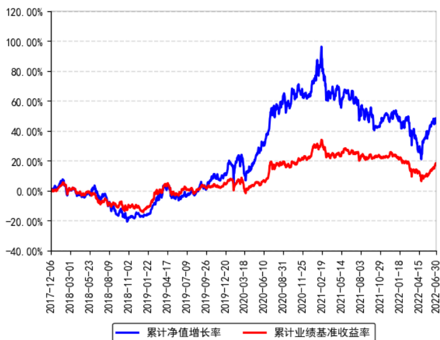
南方优享分红灵活配置混合A累计净值增长率与同期业绩比较基准收益率的历史走势对比图