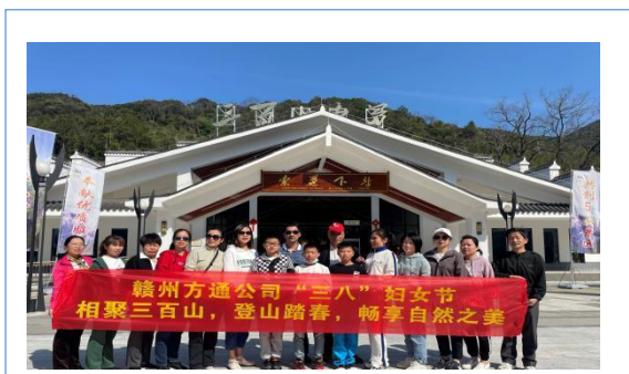
1. 三八妇女节组织职工踏青