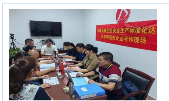
4. 企业安全生产标准化达标考评