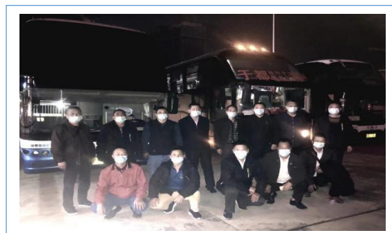
2. 抗疫突击队星夜驰援南昌抗疫