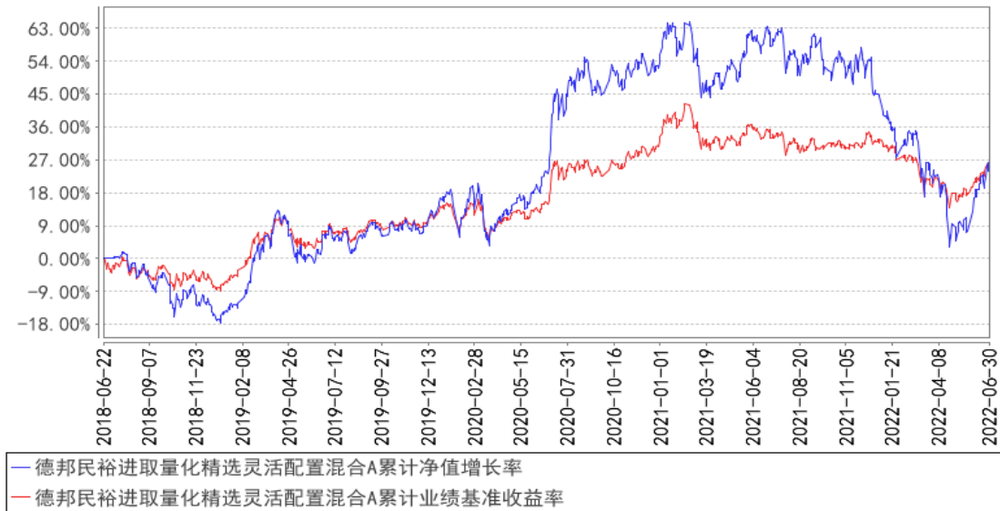
德邦民裕进取量化精选灵活配置混合A累计净值增长率与同期业绩比较基准收益率的历史走势对比图