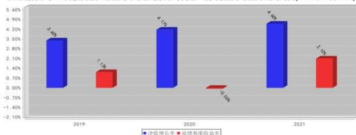
西部利得聚享一年定开债券A基金每年净值增长率与同期业绩比较基准收益率的对比图(2021年12月31日)