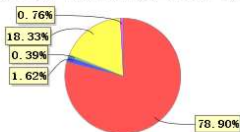
投资组合资产配置图表(2022年6月30日)