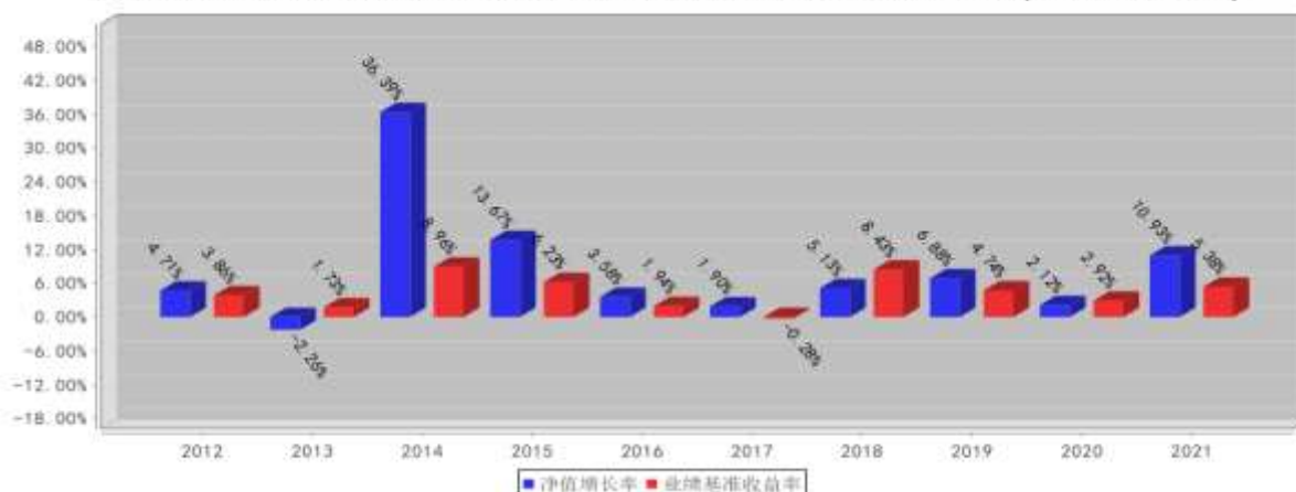
兴全磐稳增利债券A基金每年净值增长率与同期业绩比较基准收益率的对比图(2021年12月31日)