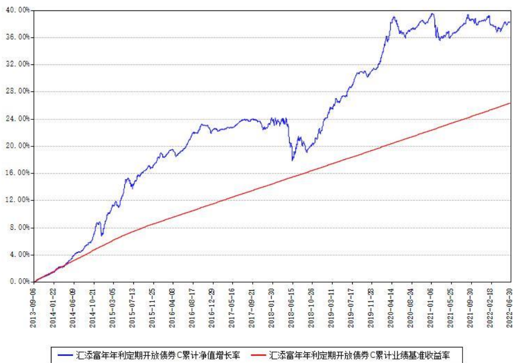
汇添富年年利定期开放债券C累计净值增长率与同期业绩基准收益率对比图