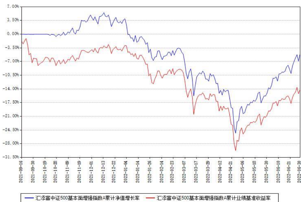
汇添富中证500基本面增强指数A累计净值增长率与同期业绩基准收益率对比图