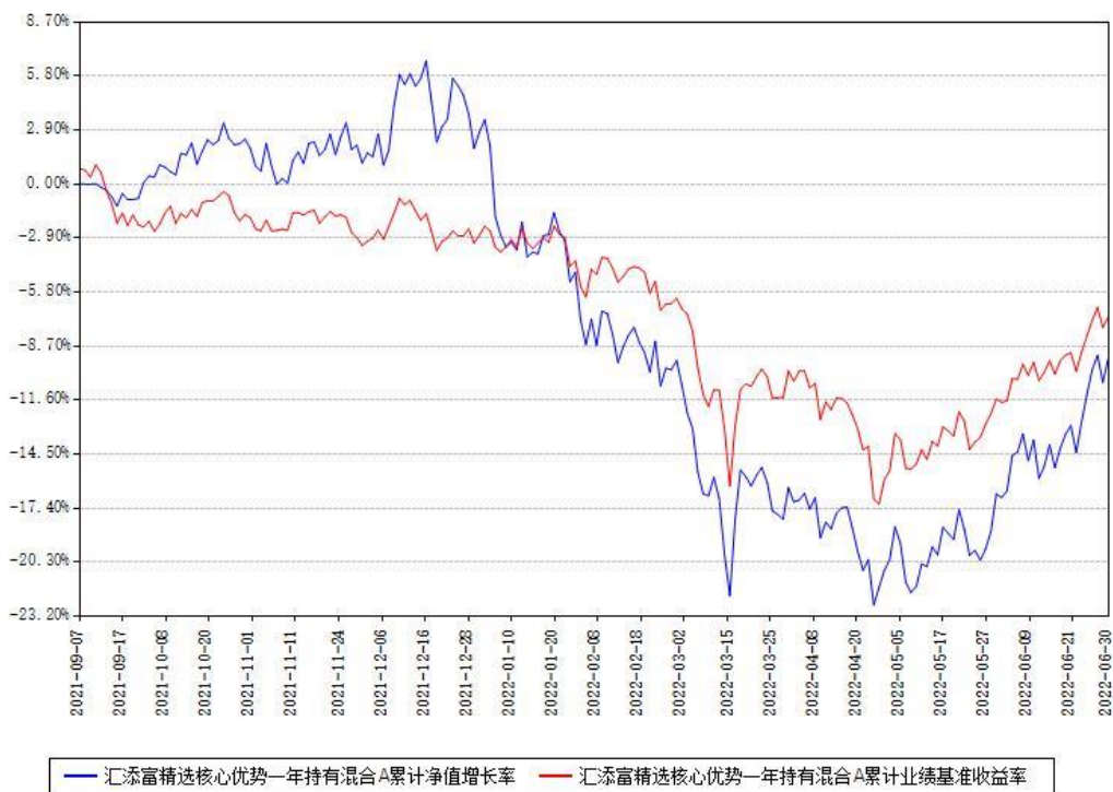
汇添富精选核心优势一年持有混合A累计净值增长率与同期业绩基准收益率对比图