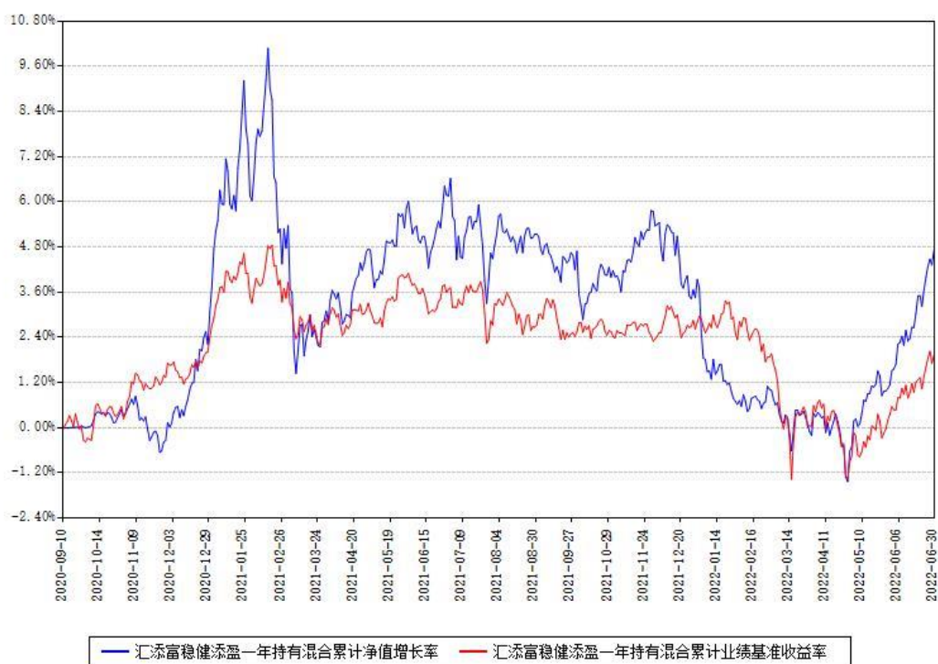
汇添富稳健添盈一年持有混合累计净值增长率与同期业绩基准收益率对比图