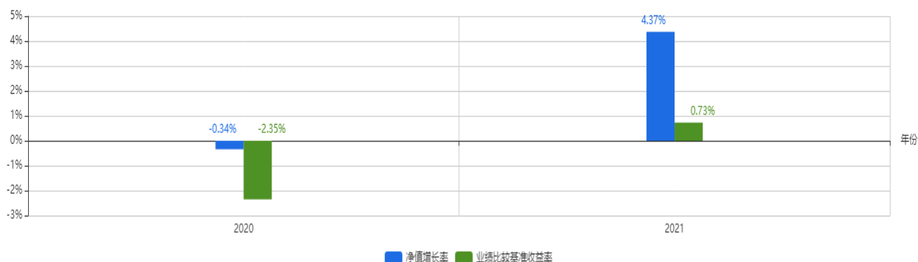
基金每年的净值增长率及与同期业绩比较基准的比较图