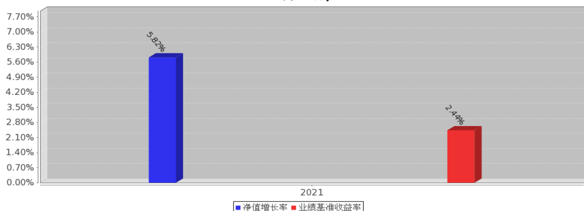
嘉实睿享安久双利18个月持有期债券基金每年净值增长率与同期业绩比较基准收益率的对比图(2021年12月31日)

注:基金的过往业绩不代表未来表现;基金合同生效当年的相关数据根据当年实际存续期计算。