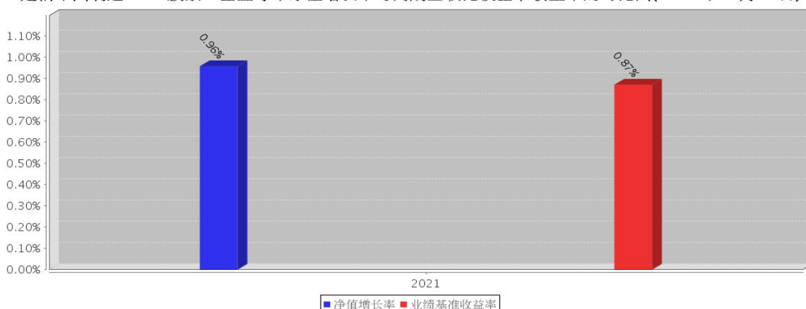
建信中国制造2025股票C 基金每年净值增长率与同期业绩比较基准收益率的对比图(2021年12月31日)