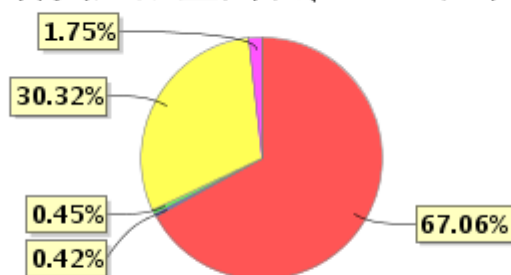
投资组合资产配置图表(2022年6月30日)

● 固定收益投资 ● 买入返售金融资产 ● 其他资产 ● 权益投资 ● 银行存款和结算备付金合计