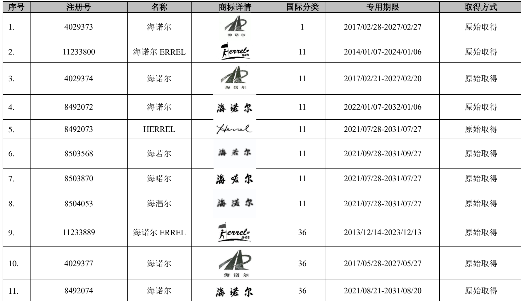
附表二：发行人及其下属企业的境内商标清单