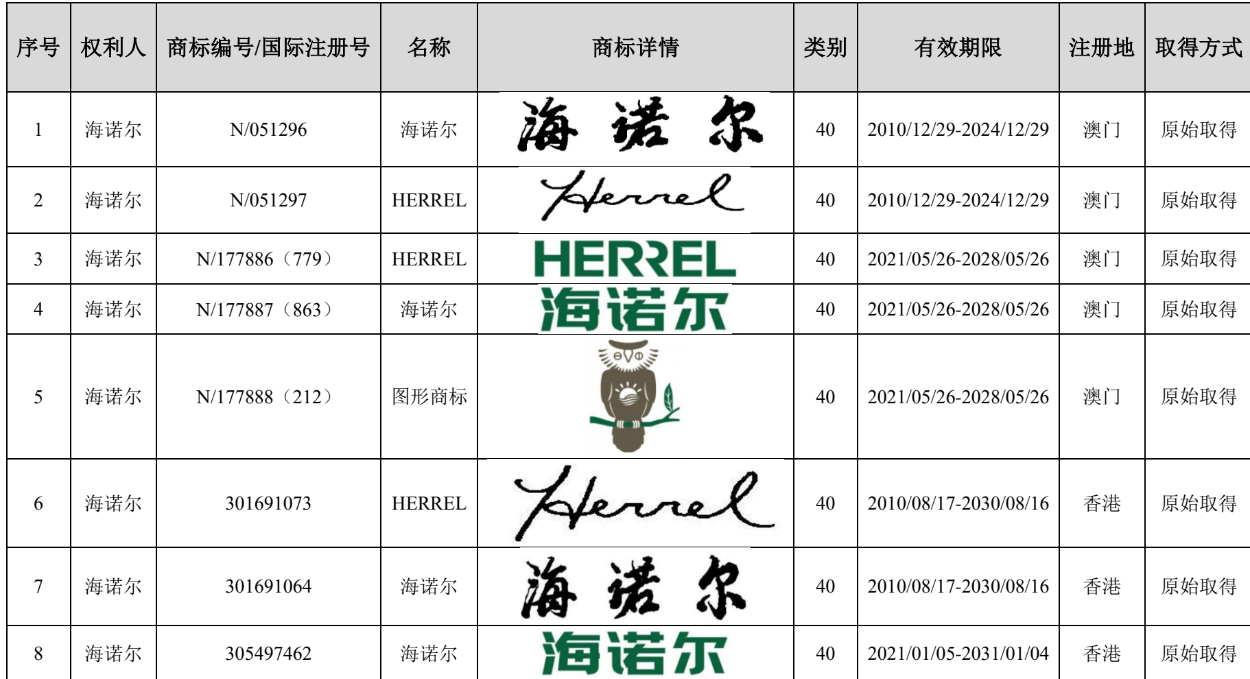
附表四：发行人及其下属企业的境外商标清单