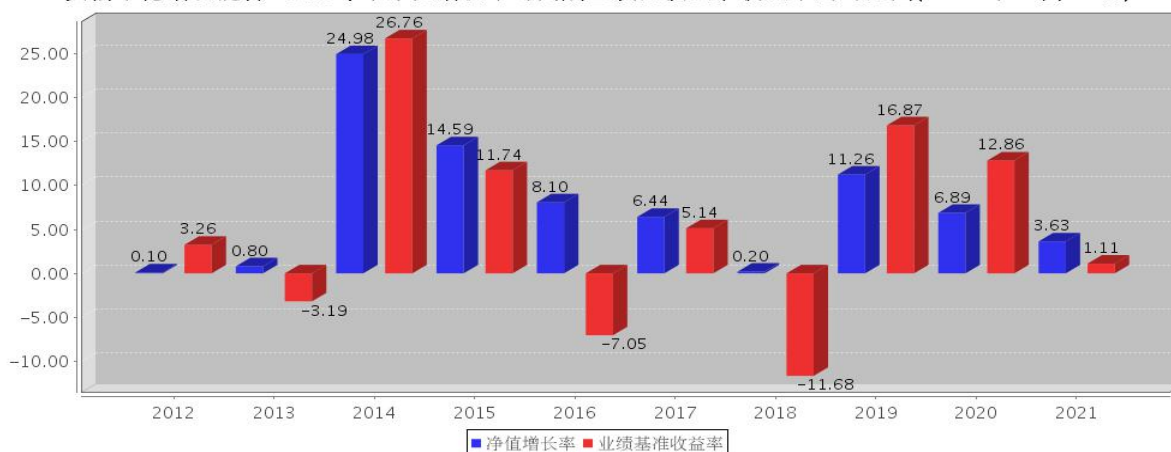
安信平稳增长混合A基金每年净值增长率与同期业绩比较基准收益率的对比图(2021年12月31日)

注：基金合同生效当年期间的相关数据按实际存续期计算。基金的过往业绩并不代表其未来表现。