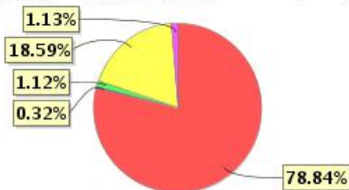
投资组合资产配置图表(2021年12月31日)

● 固定收益投资 ● 买入返售金融资产 ● 其他各项资产 ● 权益投资 ● 银行存款和结算备付金合计