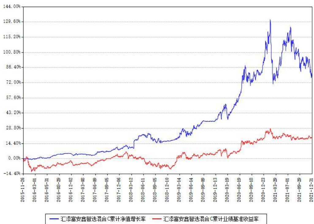
汇添富安鑫智选混合C累计净值增长率与同期业绩基准收益率对比图