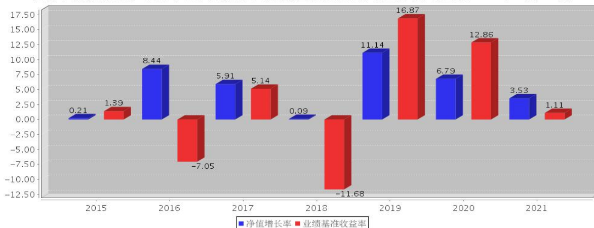
安信平稳增长混合C基金每年净值增长率与同期业绩比较基准收益率的对比图(2021年12月31日)

注：基金合同生效当年期间的相关数据按实际存续期计算。基金的过往业绩并不代表其未来表现。