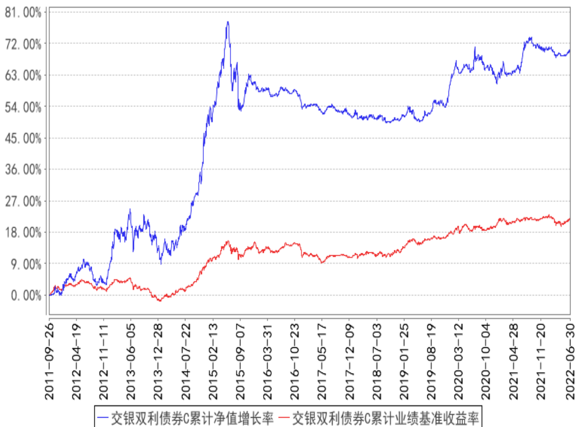
交银双利债券C累计净值增长率与同期业绩比较基准收益率的历史走势对比图

注：本基金建仓期为自基金合同生效日起的6个月。截至建仓期结束，本基金各项资产配置比例符合基金合同及招募说明书有关投资比例的约定。