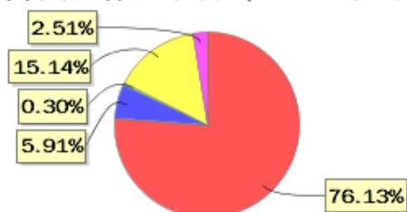
投资组合资产配置图表(2022年6月30日)

● 固定收益投资 ● 买入返售金融资产 ● 其他各项资产 ● 权益投资 ● 银行存款和结算备付金合计