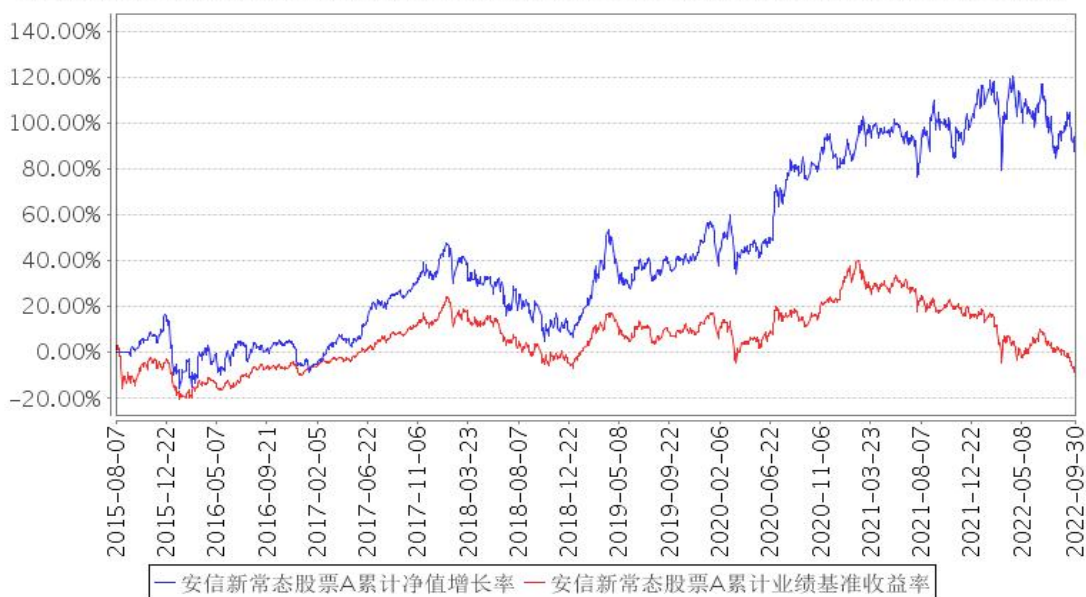
安信新常态股票A累计净值增长率与同期业绩比较基准收益率的历史走势对比图