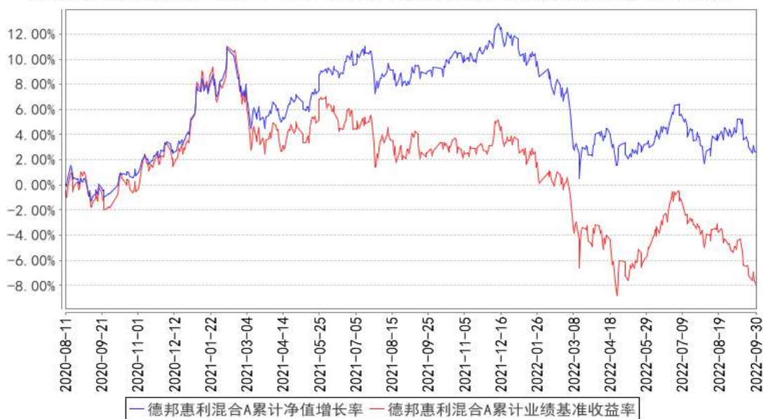
德邦惠利混合A累计净值增长率与同期业绩比较基准收益率的历史走势对比图