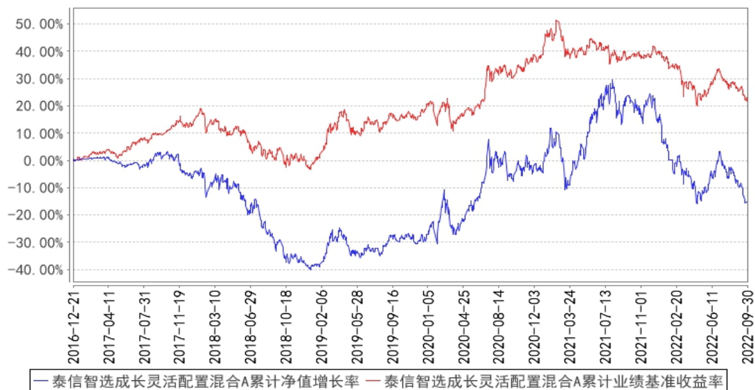
泰信智选成长灵活配置混合A累计净值增长率与同期业绩比较基准收益率的历史走势对比图