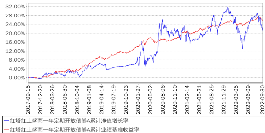
红塔红土盛商一年定期开放债券A累计净值增长率与同期业绩比较基准收益率的历史走势对比图