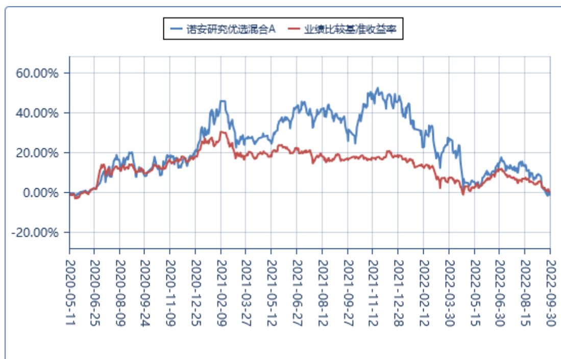
诺安研究优选混合 C